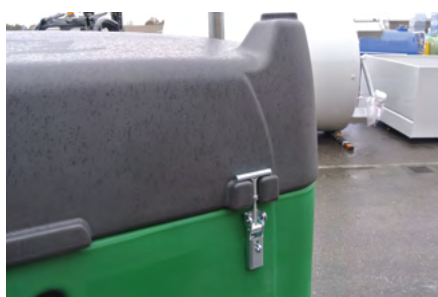
Dettaglio del coperchio con chiusura lucchettabile. Detail of the padlocked reinforced lid.