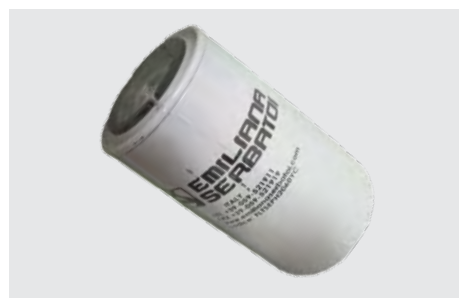
Filtro assorbimento acqua 60 L/min µ30. Water absorber filter (µ30) for flow-rates up to 60 l/m.