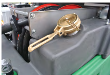
Il tappo di carico da 2". Filling quick cap 2".