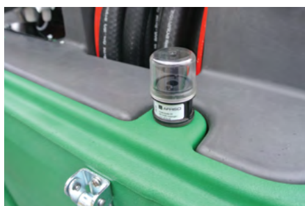
Monitoraggio intercapedine. Leak detector.