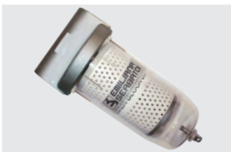
ES-Filter: 70 l/min; capacità filtrante: 10µm assorbimento acqua e 5µm impurità. ES-Filter: up to 70 l/min; Filtering capacity: 10µm water absorbing and 5µm impurities.