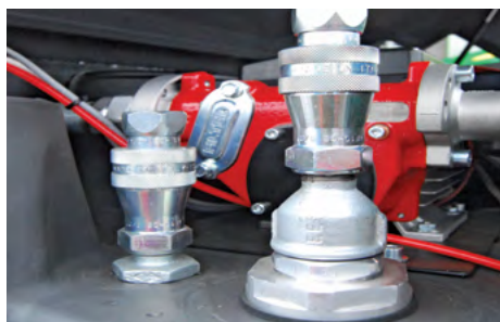
Kit di attacchi rapidi per collegamento a gruppi elettrogeni (tubo di aspirazione + attacchi rapidi di alimentazione e ritorno da 1/2"). n. 2 rapid couplings, size 1/2", for generator sets connection (feeding + return line+ suction pipe).