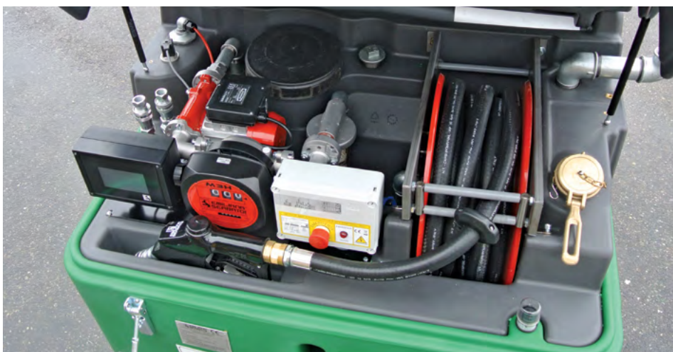
Il serbatoio con tutti gli optional installati. Tank with all accessories installed.