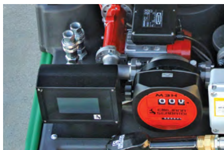
Il dispositivo Emilprobe®, il contalitri meccanico e i raccordi rapidi per la versione GE. Emilprobe® alarm system, mechanical flow meter and, on left, quick couplings for GE version.