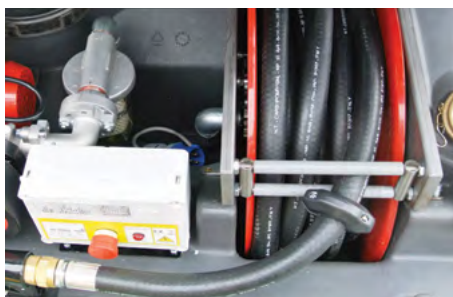
Il quadro elettrico e l'arrotolatore. Electric switchboard and spring rewind hose reel.