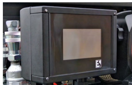
Sistema di allarme Emilprobe®. Emilprobe® alarm system.